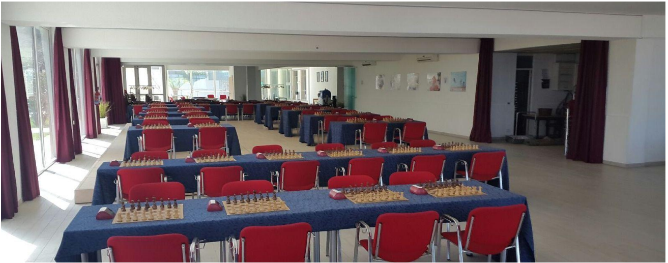
Sala Pool - capienza 90 scacchiere, 180 giocatori