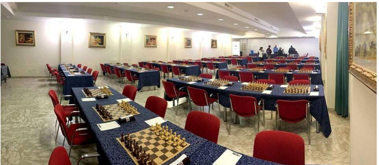
Sala Giardino - capienza 50 scacchiere, 100 giocatori