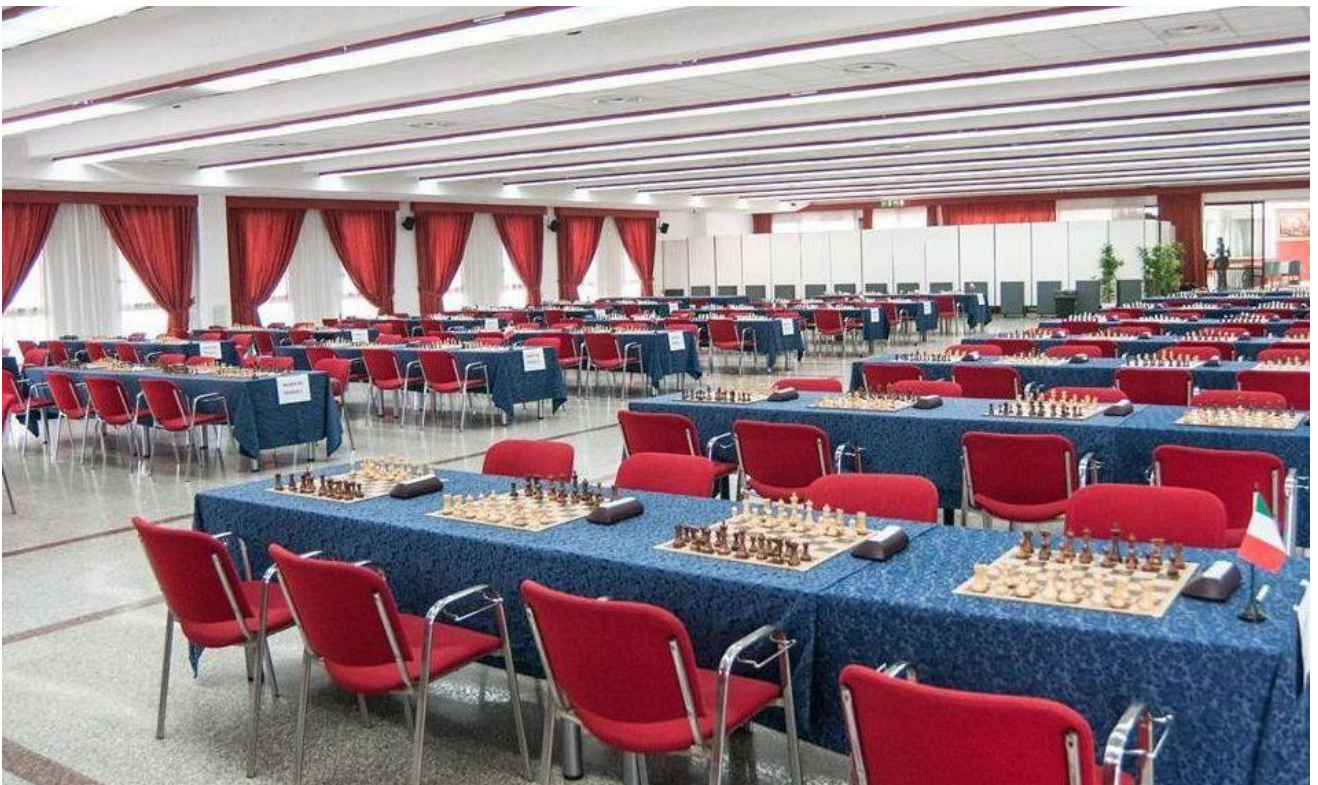
Sala Congressi – capienza 175 scacchiere, 350 giocatori