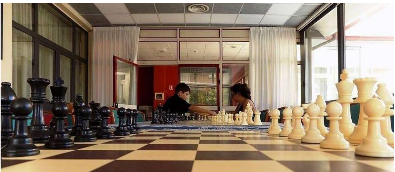
Sala Veranda – adibita a sala analisi