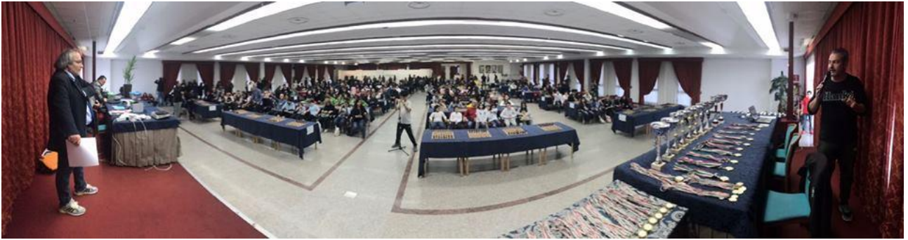
Sala Congressi – Fase Regionale Abruzzo TSS 2018