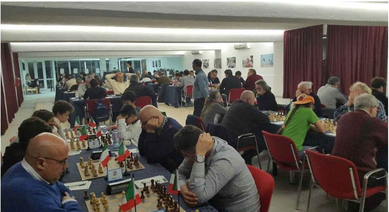
Sala Pool – Festival Internazionale Grand Hotel Adriatico