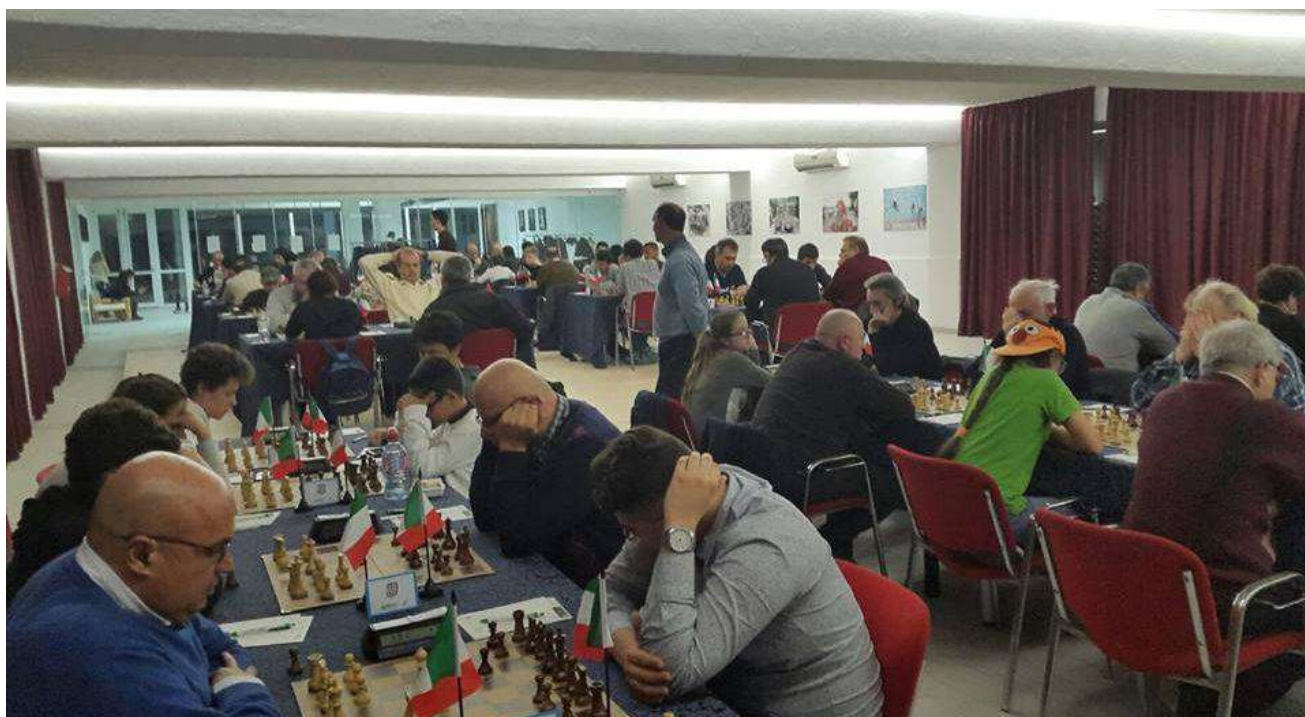
Sala Pool – Festival Internazionale Grand Hotel Adriatico