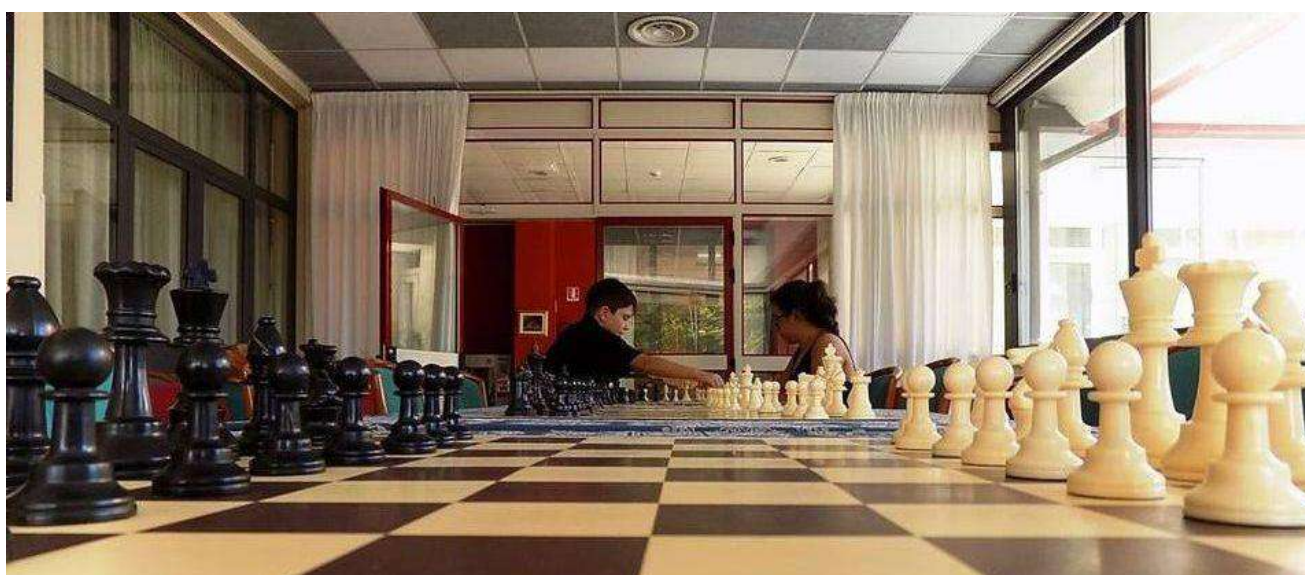
Sala Veranda – adibita a sala analisi