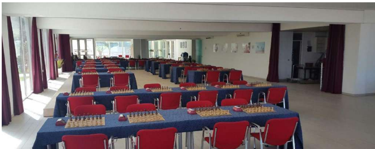
Sala Pool - capienza 90 scacchiere, 180 giocatori