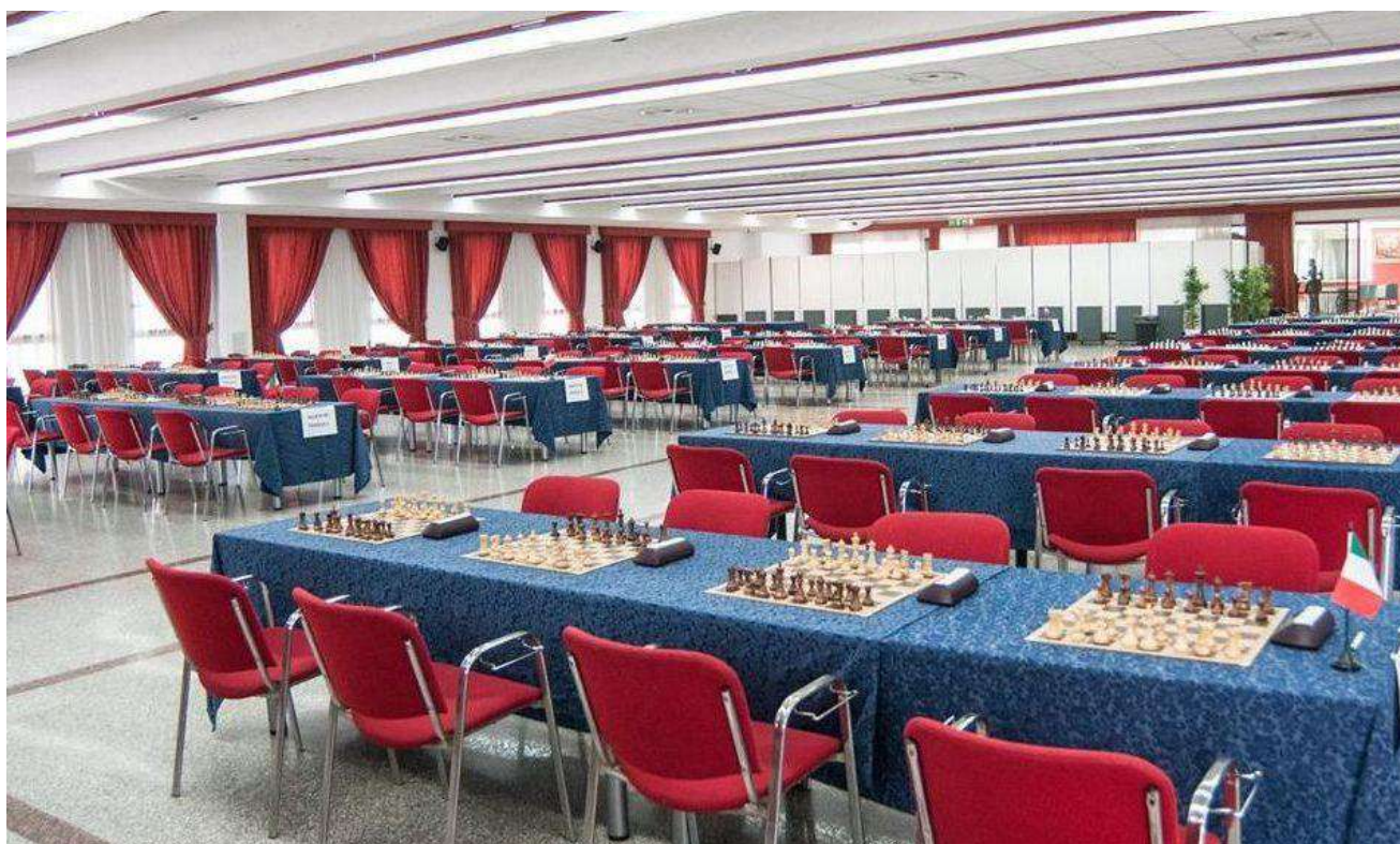
Sala Congressi – capienza 175 scacchiere, 350 giocatori