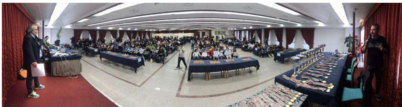
Sala Congressi – Fase Regionale Abruzzo TSS 2018