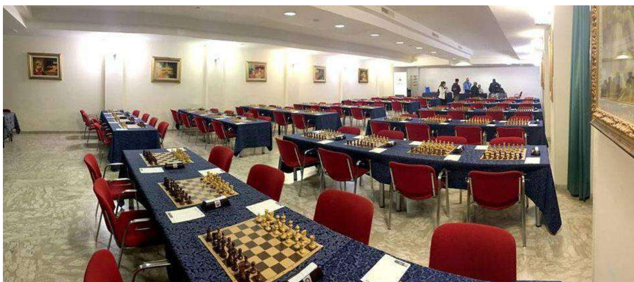
Sala Giardino - capienza 50 scacchiere, 100 giocatori