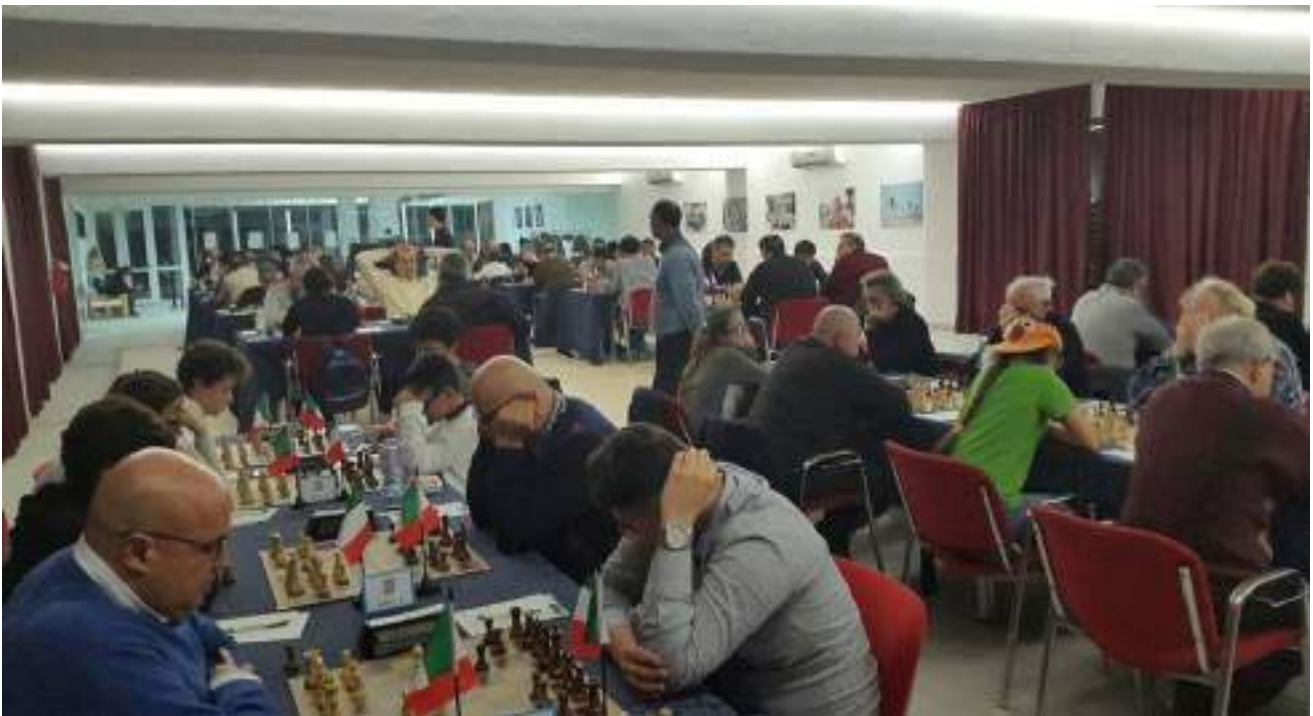
Sala Pool – Festival Internazionale Grand Hotel Adriatico