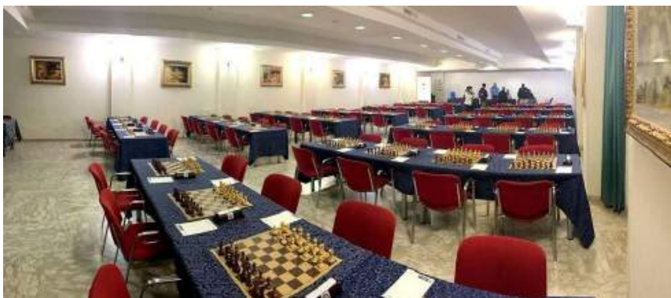
Sala Giardino - capienza 50 scacchiere, 100 giocatori