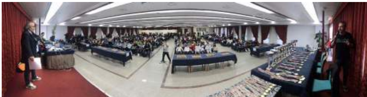
Sala Congressi – Fase Regionale Abruzzo TSS 2018