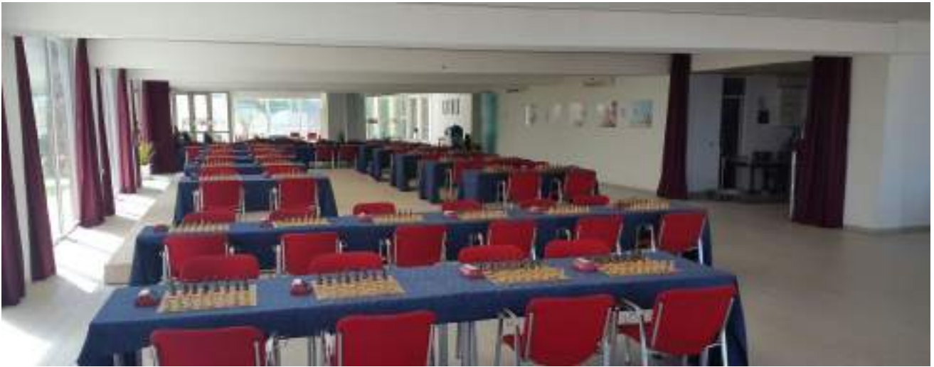
Sala Pool - capienza 90 scacchiere, 180 giocatori