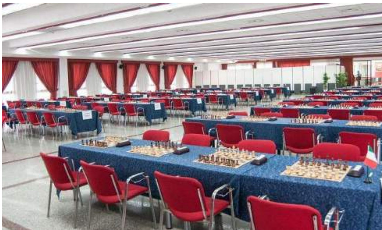
Sala Congressi – capienza 175 scacchiere, 350 giocatori