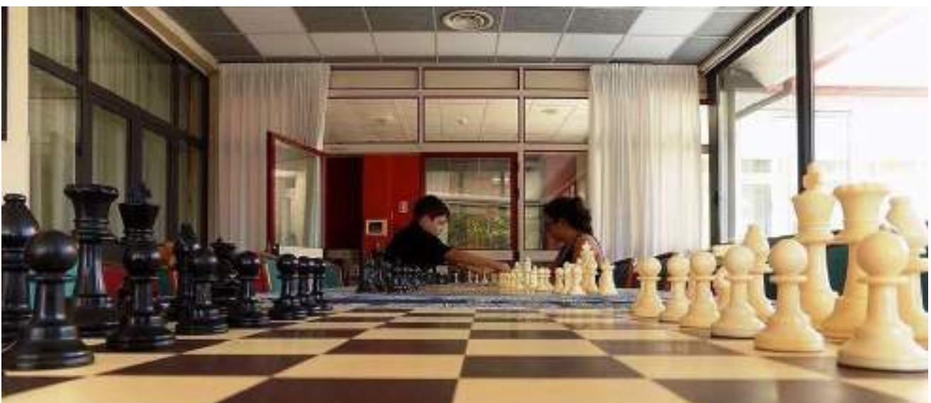
Sala Veranda – adibita a sala analisi