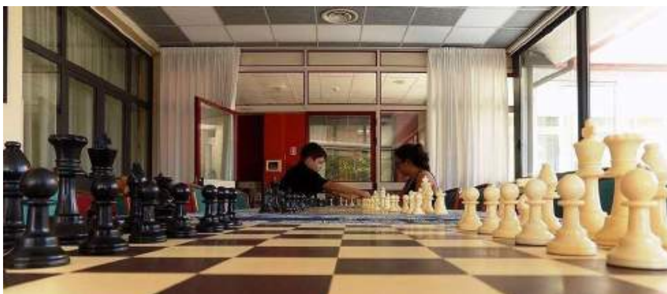
Sala Veranda – adibita a sala analisi