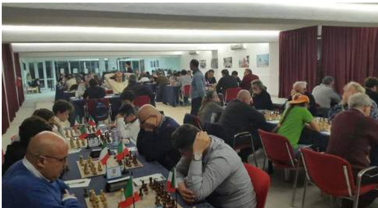
Sala Pool – Festival Internazionale Grand Hotel Adriatico