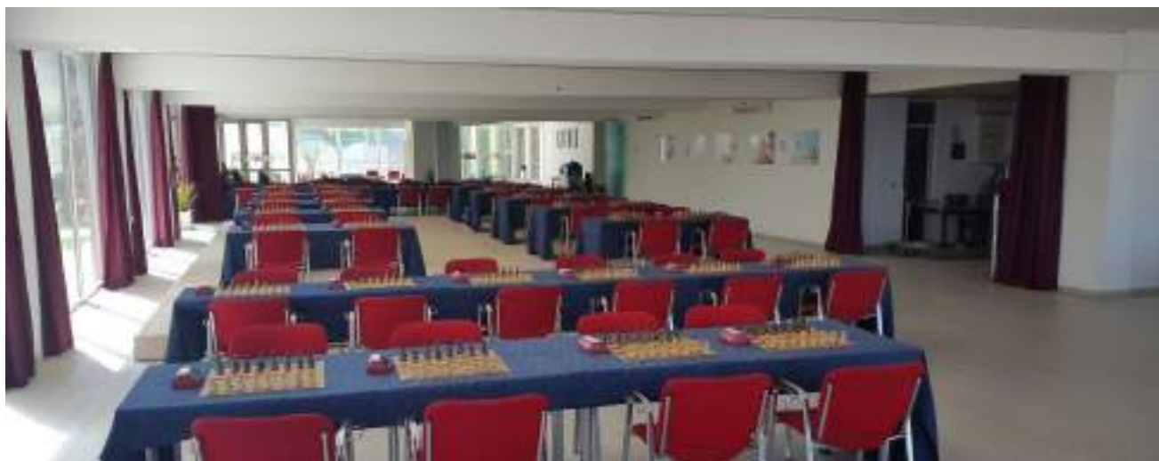
Sala Pool - capienza 90 scacchiere, 180 giocatori