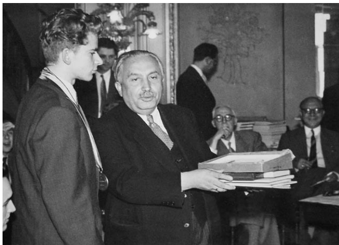
1955: Spassky diventa campione mondiale juniores