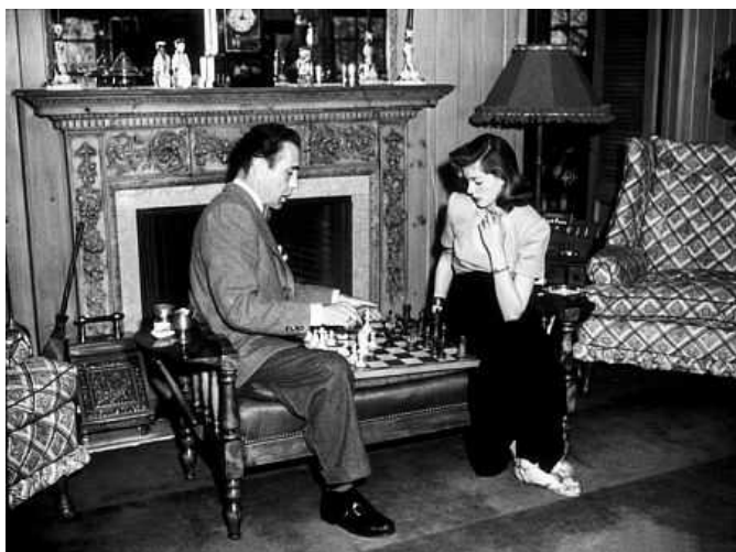
Humphrey Bogart e Lauren Bacall alla scacchiera