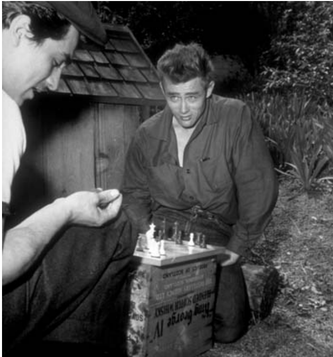
James Dean alla scacchiera