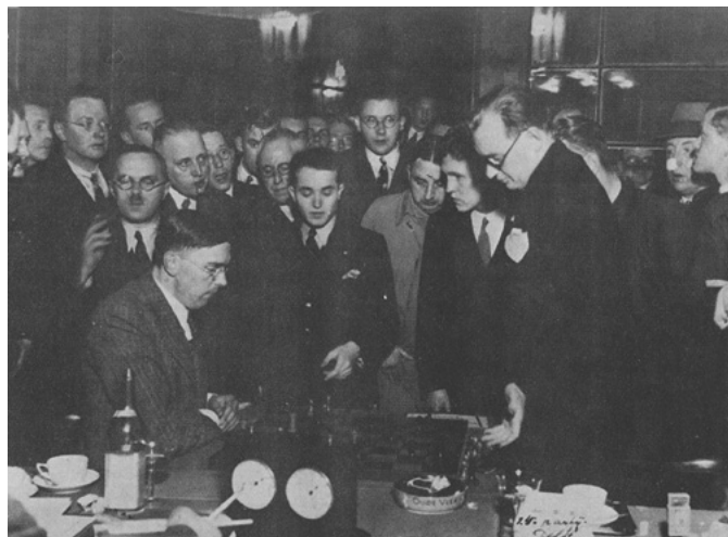
Il match di rivincita tra Euwe e Alechine