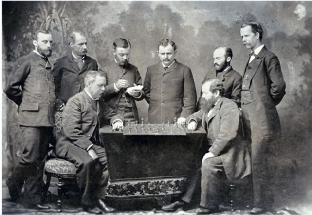
Wilhelm Steinitz alla scacchiera